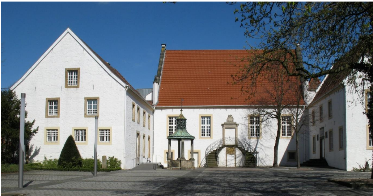
De Falkenhof in Rheine.