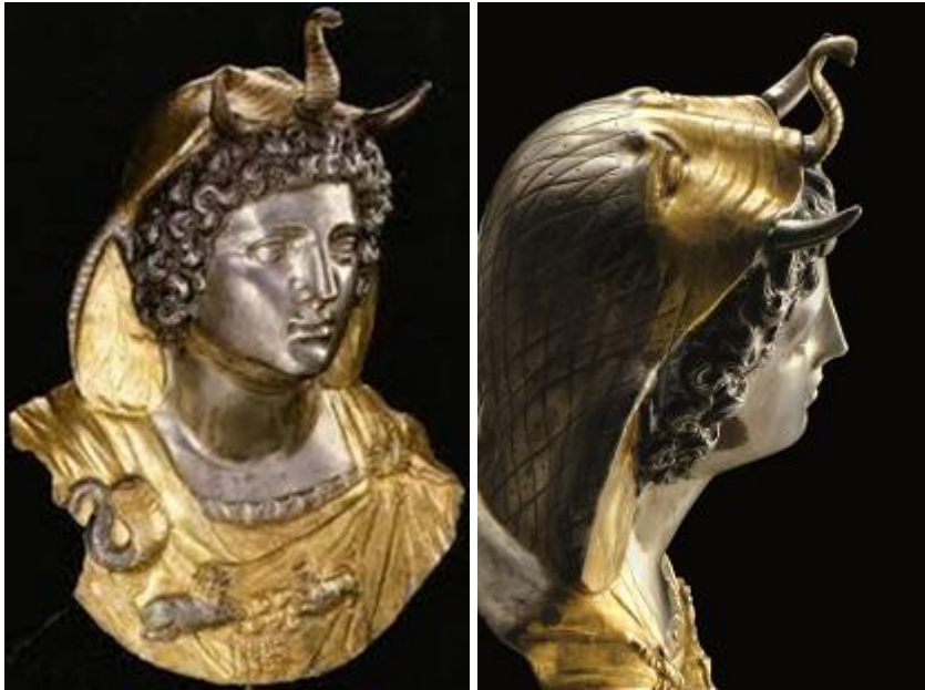
Een zilveren buste waarvan gedacht wordt dat het Cleopatra Selene afbeeldt, de dochter van Antonius en Cleopatra, late eerste eeuw voor Christus, of vroege eerste eeuw na Christus.