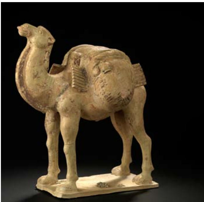
Beladen kameel, terracotta met sporen van donkerbruine glazuur, China, Tangdynastie (618-906),