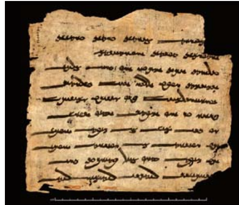
Zoroastrisch gebed, ca. 9 de eeuw, Londen, The British Library In deze Sogdische tekst staat een van de heiligste gebeden van het zoroastrisme. Hij werd ontdekt in een van de grottempels van Dunhuang.

In het Achaemenidische tijdperk was het zoroastrisme niet dominant. Men moet wachten tot de 3 de eeuw van onze tijdrekening vooraleer het de officiële religie wordt onder de Perzische dynastie van de Sassaniden (224-651). De priesters, die men wijzen noemt, reciteren de geschriften en onderhouden het heilige vuur en spelen zo een politieke en religieuze rol. De Sassaniden richten dan ook honderden vuuraltaren en tempels op.