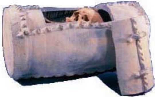
Sogdische knekelpot, terracotta, Beiting (Beshbaliq), 6 de -7 de eeuw, Xinjiang, © Turfan Museum De lichamen worden op een verhoog neergelegd om door wilde dieren van vlees te worden ontdaan. Vervolgens worden de beenderen in een knekelpot gelegd, die vaak in terracotta is. Deze potten kunnen versierd zijn met religieuze scènes.

houden, de god van het goede en van de schepping die in een constante strijd verwickeld is met het slechte. De mens moet onophoudelijk tegen de krachten van het kwade vechten door goede woorden, gedachten en actie.