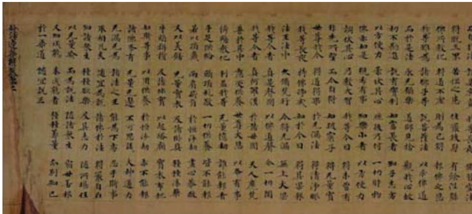
Boeddhistische Chinese soetraschriftrol, inkt op papier, 7 de -9 de eeuw, Lanzhou, © Gansu Provincial Museum Deze tekst werd in 1900 gevonden in grot 17 in Dunhuang. Het betreft een versie van de Lotus Soetra, een van de meest invloedrijke religieuze teksten in boeddhistisch China. Soetra's bestaan uit toespraken van en verhalen over Boeddha en zijn discipelen. Het reciteren ervan werd beschouwd als een middel om verdienste te verwerven en een goede wedergeboorte te garanderen.

Uitgebreide wetenschappelijke informatie over de vondsten van Dunhuang, waaraan in de tentoonstelling ruim aandacht wordt besteed, vindt U via http://idp.bl.uk . Men vindt er ook tal van illustraties en rubrieken, speciaal gericht tot leraren en studenten.