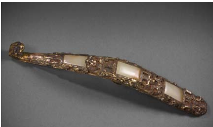
Gordelhaak van brons en goud ingelegd met jade, 3 de eeuw v. Chr., Shaoguan, Brussel, L 229.

In de Chinese taal wordt het woord 'jade' gebruikt voor kostbare en mysterieuze dingen. Zo vereert men ook de Jade Keizer , de hoogste godheid in de taoïstische godsdienst.