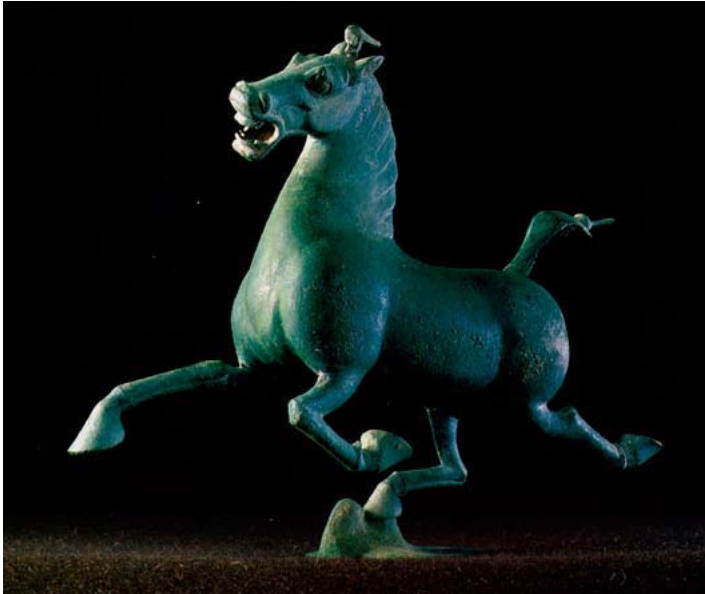
Hemelpaard, brons, 2 de eeuw, © Gansu Provincial Museum.

De Chinezen noemden de paarden uit Fergana 'paarden die bloed zweten' (hun vacht was altijd bedekt met zeer fijne druppeltjes bloed veroorzaakt door een parasiet) of 'Hemelse Paarden' omdat ze hun ontstaan toeschreven aan de vereniging van een merrie en een draak. De voorkeur die de Chinezen voor dit soort paarden hadden, werd met de tijd regelrecht snobisme. Men ging zelfs zo ver één paard te ruilen tegen veertig balen zijde. Deze dieren werden zodanig met prestige geassocieerd, dat men niet aarzelde zulke sommen op tafel te leggen, ook al waren ze exorbitant. De Ferganapaarden verschillen wel sterk van de kleine steppepony's die ook werden geïmporteerd en al eeuwen bekend waren bij de Chinezen.