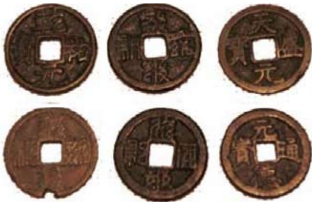
Tangutmunten naar Chinees model, 11 de – 13 de eeuw, © Ningxia Provincial Museum

Men vindt ook vreemd geld, Sassanidische drachmen en Byzantijnse muntstukken, en plaatselijke imitaties. Deze inspireren zich of op de Chinese, of op de westerse traditie, of zijn een combinatie van de twee. Sommige textielen kon men ook als valuta gebruiken, onder andere om de belastingen te betalen.