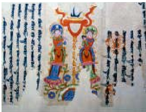
Sogdisch manicheïstische brief, 10 de eeuw, Bezeklik (Turfan), Xinjiang, Turfan Museum Cat N° 112: Correspondentie tussen lokale kopstukken van de manicheïstische kerk. De twee rechtopstaande muzikanten staan op lotussen en zijn manicheïstische priesters.

De cultus van het vuur bekleedt nog steeds een belangrijke plaats binnen het zoroastrisme.