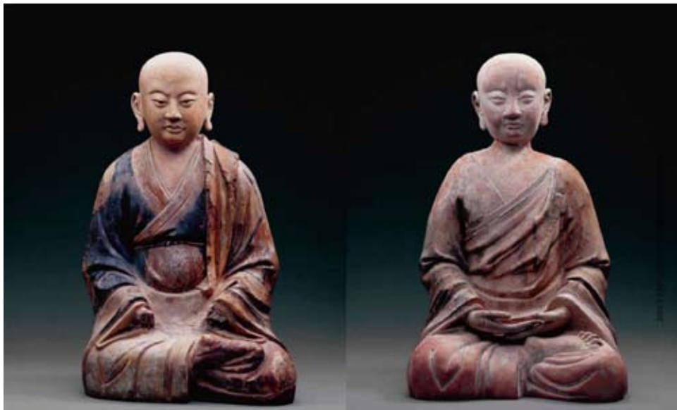
Twee boeddhistische heiligen (arhats of luohan), beschilderd aardewerk, 11 de -13 de eeuw, opgegraven in 1990, Hongfu-stoepa, Ningxia, Lanzhou