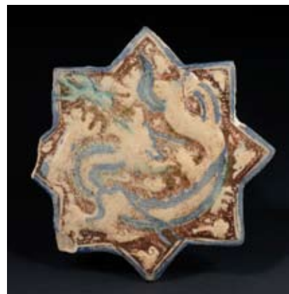
Tegel met draak, keramiek, Iran 13 de -14 de eeuw, © KMKG, inv. IS. 13 Arabieren, Perzen, Chinezen, Indiërs ... verspreidden telkens nieuwe technieken, ideeën en iconografische motieven. De draak, traditioneel het symbool van de keizerlijke macht in China, werd een motief dat zich wijd verspreidde in de islamitische iconografie.

Tijdens de Mongoolse overheersing verrijkte de kunst zich met nieuwe elementen uit het Verre Oosten die zich harmoniseerden met het bestaande esthetische vocabularium. Zo ziet men op verschillende objecten motieven verschijnen die aan de Chinese iconografie werden ontleend: lotus, pioenroos, druiventros, wolk, draak.... In de Perzische miniaturen is de invloed van Chinese schilderkunst eveneens aanwezig, voornamelijk in de weergave van bomen, rotsen, wolken en water.