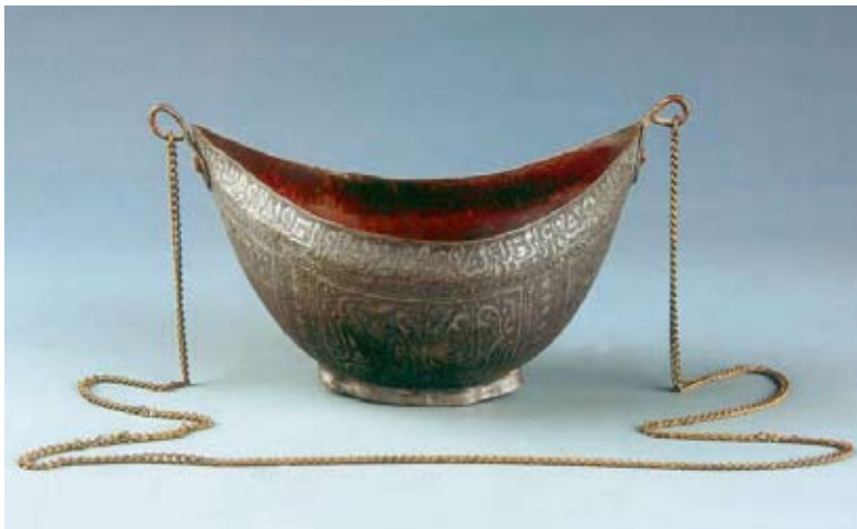
Zilveren aalmoezenbeurs, 14 de eeuw, Kashgar, © Ningxia Provincial Museum

Centraal-Azië te veroveren. Lange tijd zullen deze verschillende religies zich naast elkaar ontwikkelen. Maar uiteindelijk wordt de expansie van de islam een van de factoren bij het verdwijnen van de boeddhistische beschavingen langs de Zijderoute. De Turkse dynastie van de Karakhaniden (840-1212), die sinds de 8 e eeuw in Kashgar is gevestigd en vazal van het Oeigoerse Rijk in Mongolië is, roept zijn onafhankelijkheid uit in 840. In de 10 de eeuw wordt de dynastie geïslamiseerd en lanceren ze militaire aanvallen op de boeddhisten vanuit Kashgar. Zo veroveren ze heel Transoxanië. In enkele eeuwen tijd is de regio van de Taklamakan islamitisch geworden en zijn de stupa's en boeddhistische tempels verlaten of vernield.