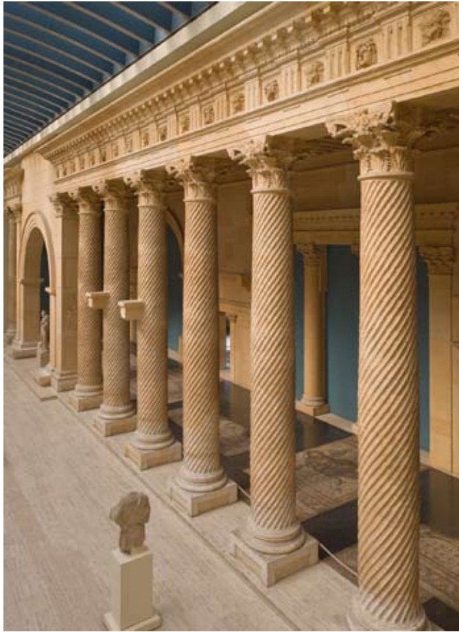
Reconstructie van de zuilengalerij van Apamea, 2de eeuw, © KMKG Apamea aan de Oronto, gesticht door de Seleuciden voor de Griekse kolonisten, werd een Romeinse stad wanneer heel Syrië in de 1e eeuw v. Chr. wordt veroverd. Na een aardbeving wordt de stad in de 2e eeuw heropgebouwd volgens een Grieks stratenplan. De grote zuilengalerij strekt zich uit van Noord naar Zuid over een lengte van 2km. De portiek uit 469, zo'n 7,5m breed en geplaveid met mozaïeken, getuigt van de economische welvaart van deze stad met uitstekende ligging op de karavaanwegen.

Romeinen op hun beurt exporteerden wijn, papyrus, wol, linnen, amber, koraal, asbest, brons, lampen en vooral glas. Ook de Indische handelsactiviteit kan niet worden genegeerd; zij voorzag het Westen van slaven, wilde en tamme exotische dieren, bont, kasjmier en katoen.