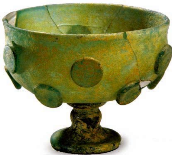
Sassanidische glazen beker, ca. 6 de eeuw, Gevonden in 1989, Simsimgrotten, Kucha, Urumqi, © Xinjiang Uygur Autonomous Region Museum.