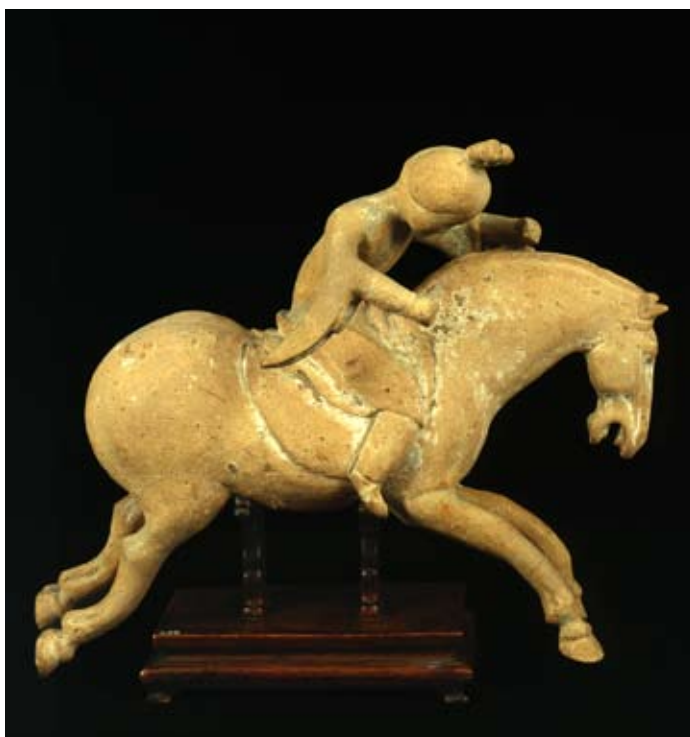
Polospeelster, terracotta Tangdynastie (618-906), China, Inv.E.O.2516

Tijdens de Tangdynastie kwam het fokken van paarden tot volle ontwikkeling. Bovendien kon China rekenen op een constante stroom tribuut en geschenken uit het Westen. Het paard werd niet alleen als rijdier gebruikt. Polo, uitgevonden aan het Perzische hof, was een echte rage. De eerste Tangkeizer, Taizong (629-649) werd gebeten door deze sport bij een demonstratie door teams uit Turfan. De keizer Xuanzong (712-755) moedigde op zijn beurt het spel aan op zijn grondgebied omdat hij vond dat het een goede oefening was voor de troepen. En ook de aristocratie was dol op gevechten te paard met honden of jachtluipaarden.