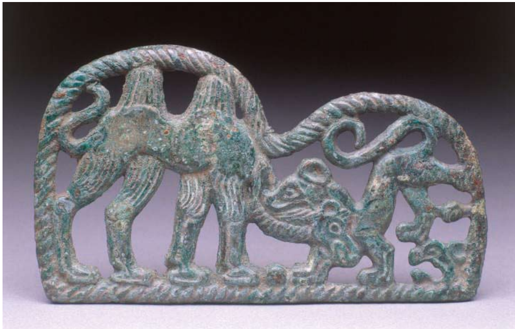
Sieraad in de vorm van een kameel en een tijger, brons, 2 de -1 e eeuw v. Chr., Deze dierenstijl is typisch voor de steppen.

In 206 v. Chr. ruimt de Qindynastie baan voor de Handynastie; zij verlengt de Chinese Muur om de eenheid van China te bewaren. Op zoek naar bondgenoten voor een campagne tegen de Xiong-nu zendt keizer Wudi rond 138 v. Chr. de jonge hofofficier Zhang Qian westwaarts. Hij wordt al vlug gevangengenomen door de Xiong-nu, bij wie hij 10 jaar zal verblijven. Na zijn ontsnapping reist hij verder en belandt in de vruchtbare vallei van Fergana waar hij voor het eerst de 'Hemelse paarden' ziet. Na een tocht van 13 jaar keert Zhang Qian terug naar het keizerlijke hof. Hij roemt er de nieuwe contreien, de zilveren munten van de Parthen in Iran, de edelstenen uit Khotan en de fantastische paarden van Fergana. De keizer heeft snel het militaire belang door van deze snelle sterke paarden, die hem van nut kunnen zijn in de gevechten tegen de nomaden. Nadat Zhang Qian tijdens een tweede missie enkele honderden paarden kan bemachtigen, verslaat China in 51 v. Chr. de oostelijke en westelijke Xiong-nu. China kan nu ongestoord relaties met het westen aanknopen en stuurt zijn handelaars uit over de bloeiende handelsroutes van Centraal-Azië. De Chinezen ruilen in de eerste plaats fijne zijden stoffen tegen paarden. Aldus wordt het exportverbod van zijde door toedoen van de Chinese keizer zelf opgeheven en wordt de eigenlijke zijderoute geopend. Zijde wordt een belangrijk product zowel voor de buitenlandse handel als in de geschenkenpolitiek die onder Wudi's gezag werden ingesteld.