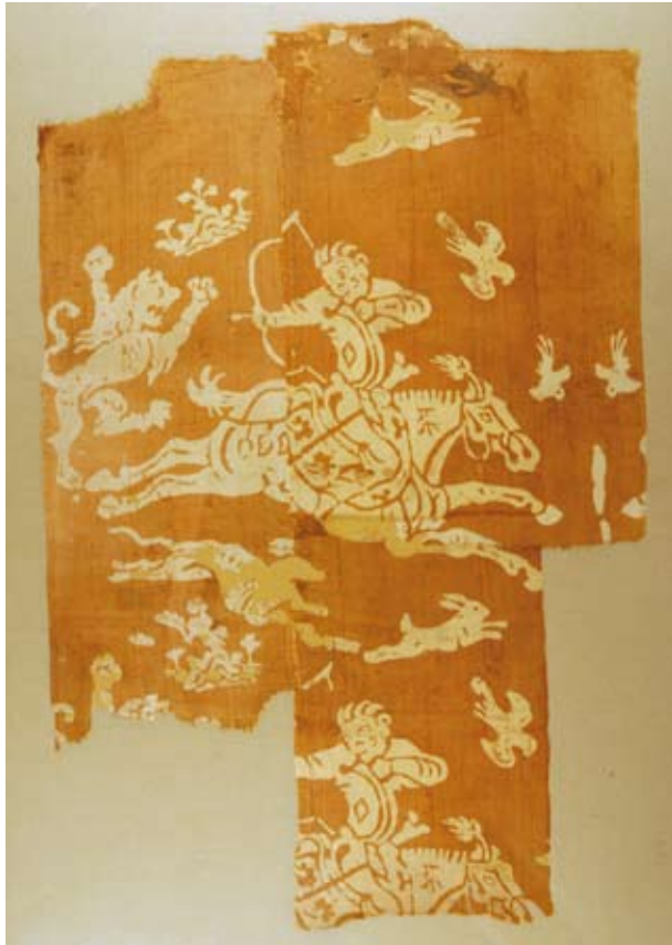
Zijdeweefsel met jachttafereel, 7 de -8 ste eeuw, opgegraven in 1973, graf 119, Astana, Turfan, Urumqi, © Xinjiang Uygur Autonomous Region Bureau of Cultural Heritage.

Vanuit Khotan zou de techniek in de 4 de eeuw bekend raken in het Oost-Romeinse rijk, waarna het nog eens ongeveer 500 jaar zou duren vooraleer de kennis van het procedé West-Europa bereikte.