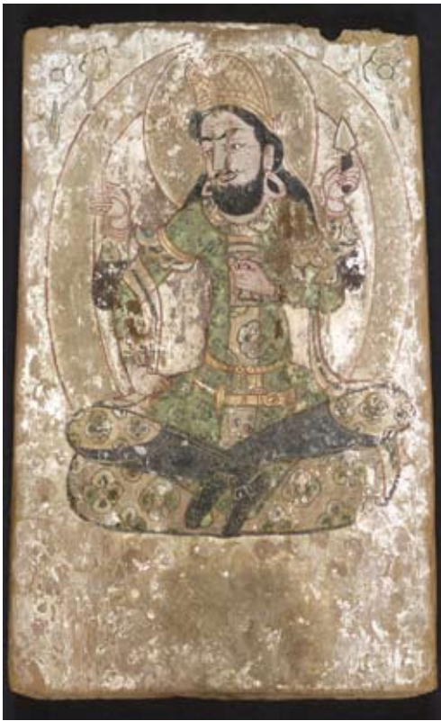
Votiefpaneel, inkt en pigmenten op hout, 6 de eeuw, opgegraven in 1900 door Aurel Stein, Dandan-Uiliq, Khotan, Londen, © The Trustees of The British Museum.

Op dit votiefpaneel is de vierarmige god van de zijde voorgesteld. We zien een gekroonde en bebaarde figuur die op een gebloemd kussen zit en gekleed is in een vorstelijk gewaad en hoge laarzen. Van zijn onderste handen rust er één op zijn knie, terwijl hij in de andere hand een beker houdt. In de hand links boven houdt hij een weefkam en in zijn vierde hand een schietspoel. Deze voorstelling vertoont veel gelijkenis met Perzische miniaturen van latere eeuwen.