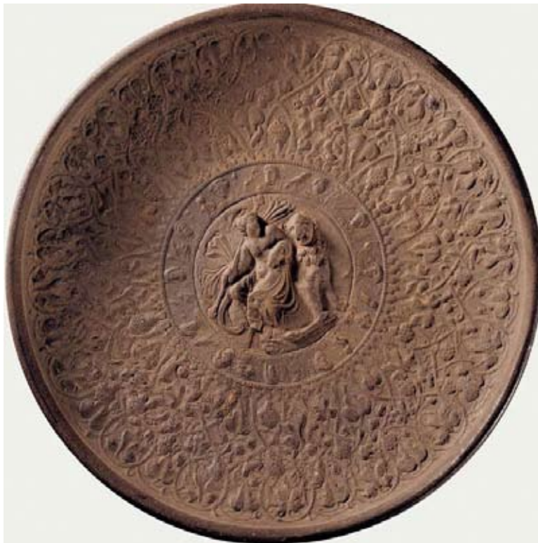
Schotel met Dionysos, verguld zilver, 2 e -3 e eeuw, gevonden in Lanzhou, © Gansu Provincial Museum.

De eerste bruggen werden in de oudheid geslagen toen de veroveringen van Alexander de Grote hem rond het midden van de 4 de eeuw voor onze tijdrekening tot in Centraal-Azië brachten. Zijn rijk strekte zich uit van het Middellandse Zeegebied en Egypte tot India, Pakistan en Afghanistan. Zijn invloed was dus doorslaggevend en maakte geleidelijk aan de uitbouw mogelijk van karavaanroutes die het Nabije Oosten met het Midden-Oosten verbonden.