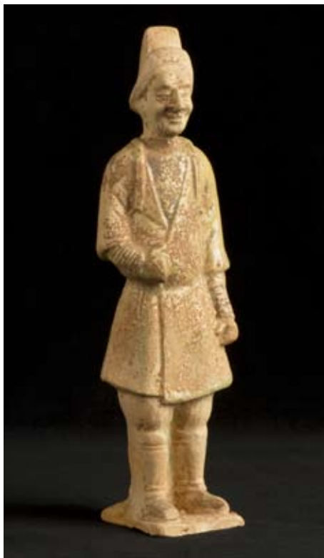
Vreemdeling, China, Tangdynastie (618-906), Inv. EO. 883

Deze schilderachtige wereld was een bron van inspiratie voor de beeldhouwers die in hun werken de kleine details van het dagelijkse leven hebben vertaald.